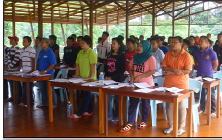
Forest Fire Training (1—3 August 2016)