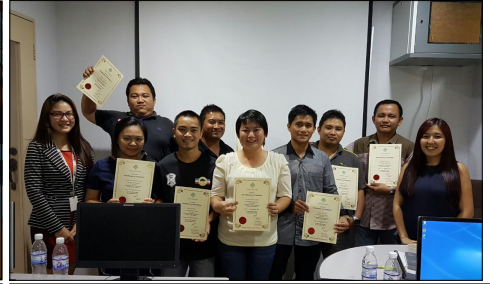
ArcGIS Training (07—09 September 2016)

Tahniah kepada semua peserta dalam Tree Identification Course (19—22 May 2016)!