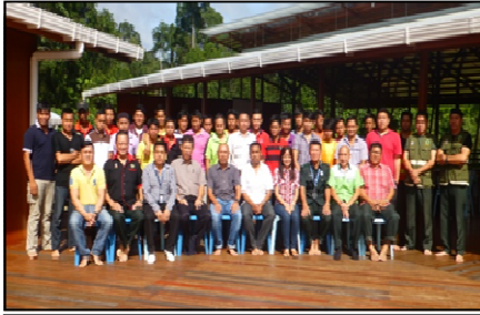
Wildlife Honorary Warden Training (26-28 July 2016)

Syarikat ini komited dalam menyediakan dan mendedahkan pekerja dengan lebih latihan, seminar, ceramah, untuk memperbaiki dan membangunkan individu-individu ini. Contohnya, Syarikat telah menghantar pekerja untuk mengikuti latihan setahun di Institusi Perhutanan Sabah untuk Kursus Renjer Hutan, Kursus ArcGIS, ceramah dan lain-lain.