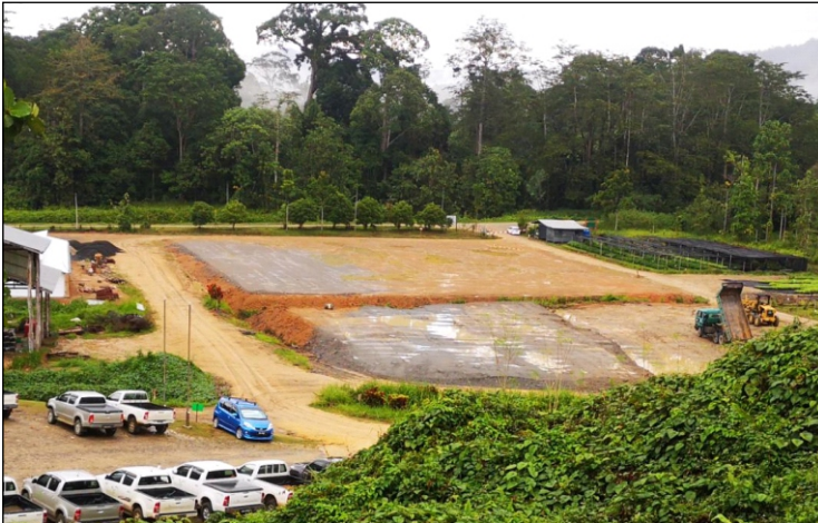
Penyediaan tapak untuk pembinaan rumah hijau.

Seperti yang kita sedia maklum, kita adalah dalam fasa menaik taraf nurseri kita dengan Projek Rumah Hijau. Pembinaan rumah hijau ini adalah untuk menangani cabaran dan masalah yang kita hadapi dengan nurseri kita. Cabaran utama nurseri pada masa lalu adalah masalah perosak dan penyakit yang mengganggu pengeluaran terutamanya serangan kulat (rendaman). Keadaan lembap di nurseri menyebabkan lebih daripada 10,000 kes kematian pada bulan musim hujan. Untuk memastikan pengeluaran anak benih yang sihat di bawah persekitaran yang terkawal, projek penambahbaikan nurseri telah dimulakan pada bulan Julai 2019. Projek rumah hijau adalah untuk menampung jumlah semaian yang lebih tinggi yang diperlukan oleh sistem BASIL 100. Tambahan pula, rumah hijau dapat menampung perubahan sistem nurseri kita dari beg poli ke dulang. Setelah menyelesaikan pengeluaran purata yang diperlukan untuk rumah hijau untuk menampung, kontrak telah ditandatangani pada Februari 2020. Walau bagaimanapun, kerana Perintah Kawalan Pergerakan, projek ini hanya bermula pada bulan Jun 2020.