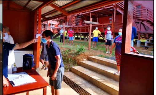
Logiman membuat pemantauan suhu