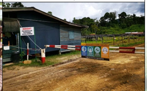
Penambahbaikan dalam Pencegahan Covid-19 di tempat kerja