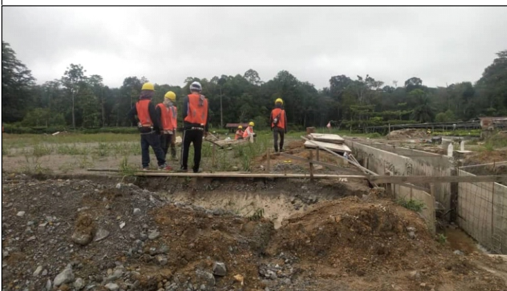
Susun atur rumah hijau di tapak.