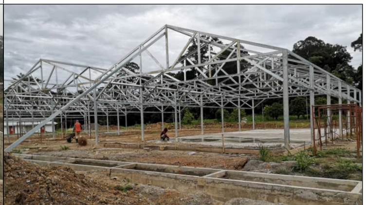
Lantai rumah hijau dikonkrit.