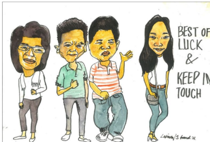
Sumbangan Karya Oleh : Logiman J. Gamad